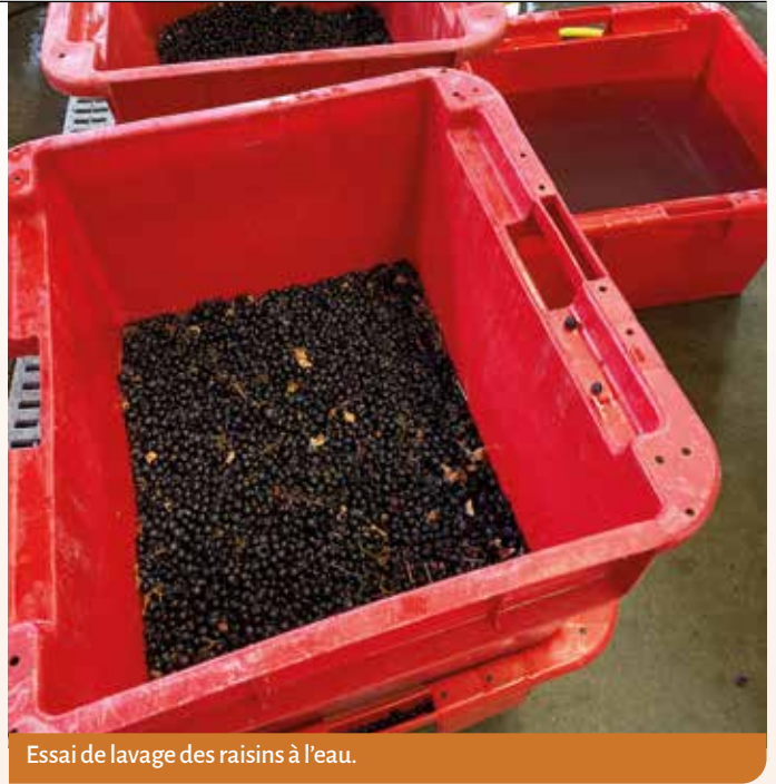
Essai de lavage des raisins à l'eau.

localisation des résidus dans la baie ont montré qu'elles sont principalement localisées dans la pulpe ce qui explique qu'elles soient peu éliminables par lavage, quels que soient les procédés utilisés. D'autres molécules sont plutôt présentes sur la pellicule comme cuivre, folpel, amisulbrom et sont donc mieux lessivées. Précisons toutefois que peu de substances actives sont totalement éliminées par cette opération