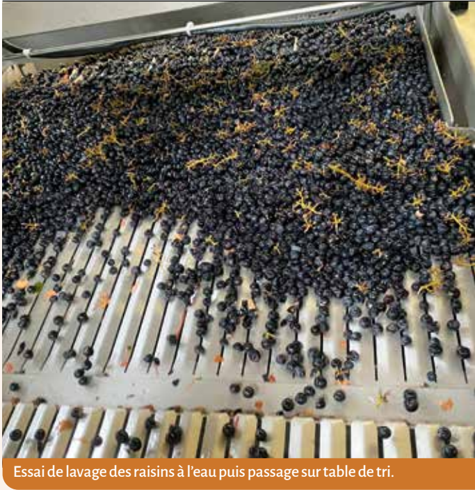
Essai de lavage des raisins à l'eau puis passage sur table de tri.