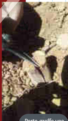
Porte-greffe une fois fendu.

5 Fendre le porte-greffe verticalement à l'aide d'une hachette et d'une massette. La zone fendue est ensuite entourée et serrée avec de la ficelle de chanvre ou de jute (dégradable). Gratter légèrement l'écorce pour bien voir l'orientation et la localisation des vaisseaux.