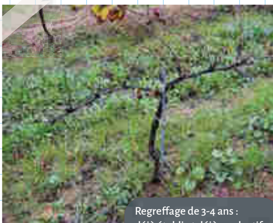
Regreffage de 3-4 ans : déjà établi et déjà productif.