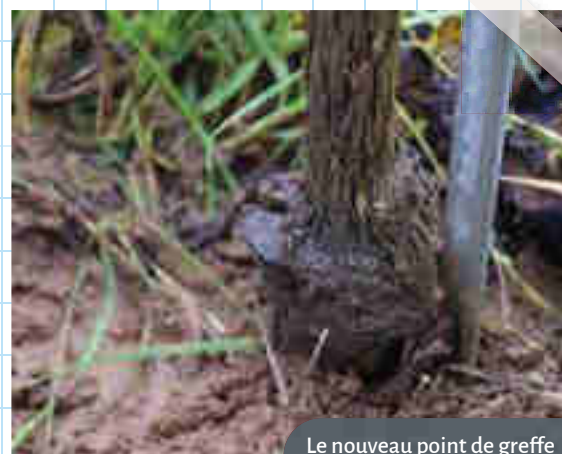
Le nouveau point de greffe après 3-4 ans, productif.