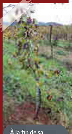
À la fin de sa première saison, la greffe a souvent produit suffisamment de bois pour permettre l'établissement du tronc, parfois d'un bras ou des deux...