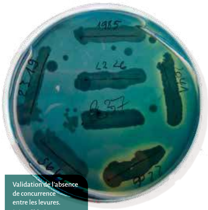
Validation de l'absence de concurrence entre les levures.

des souches, des contrôles d'implantation des levures par PCR Delta à trois étapes de la fermentation alcoolique ont été réalisés : début FA, mi-FA et fin FA. Cette technique nous a permis de connaître l'identité des levures qui co-dominent la fermentation, et d'estimer l'importance de chacune par rapport aux autres.