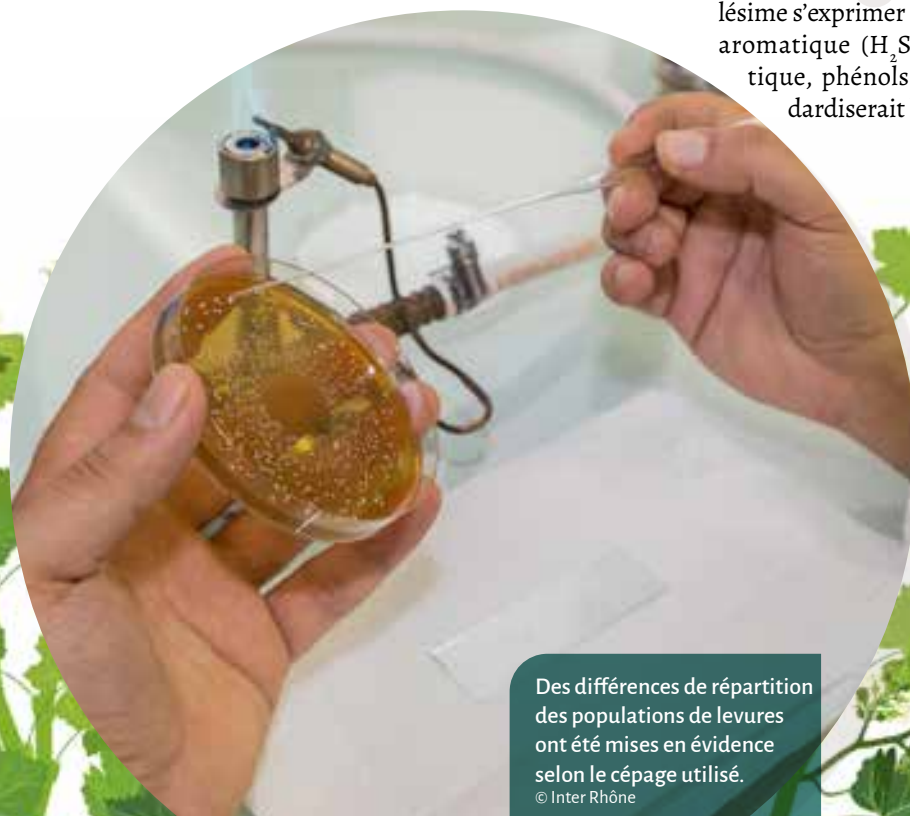
Des différences de répartition des populations de levures ont été mises en évidence selon le cépage utilisé.