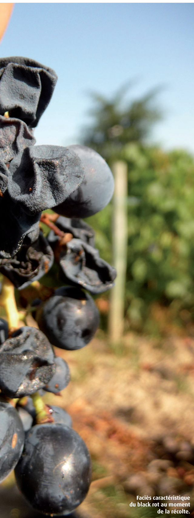
Faciès caractéristique du black rot au moment de la récolte.