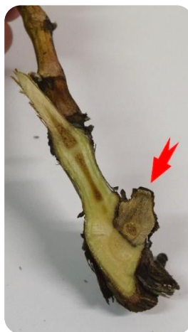
Un cône de dessèchement