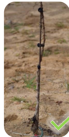
Un tronc bien attaché, avec de nombreux entre-nœuds

Un tronc établi dès la première année grâce à l'ébourgeonnage et à l'attachage. Le tronc établi de cette façon a de nombreux entre-nœuds : les diaphragmes agiront comme autant de « barrières » limitant la pénétration des nécroses dans le bois. Tandis qu'un tronc établi en 2 ème feuille aura moins de diaphragmes, car sa vigueur est plus forte et ses entre-nœuds sont plus longs.