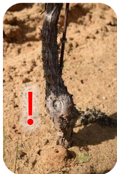
À éviter : les plaies importantes sur le tronc

Un trajet de sève continu avec moins de grosses plaies de taille sur le bourrelet de greffe et sur le tronc.